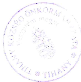
Tósocki Imre polgármester