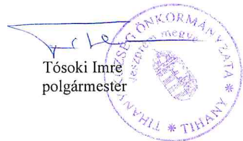
Tósocki Imre polgármester