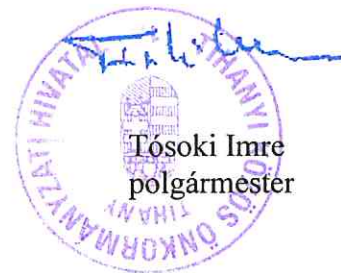
Tósocki Imre polgármester