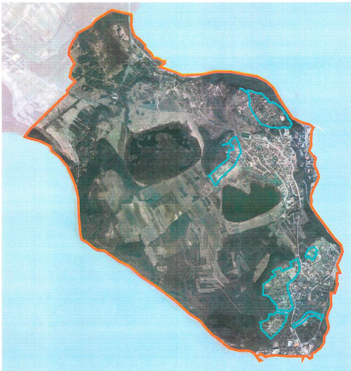
A módosítással érintett területek elhelyezkedése

Tihany község Önkormányzatának képviselő-testülete a község településrendezési eszközeinek módosításáról döntött. (4. Melléklet) A településfejlesztési koncepcióról, az integrált településfejlesztési stratégiáról és a település- rendezési eszközökről, valamint egyes településrendezési sajátos jogintézményekről szóló 314/2012. (XI.8.) Kormányrendelet (továbbiakban: Eljr.) 32. § (6) bekezdésében foglaltakat figyelembe véve a módosítás teljes eljárás keretén belül történik. A településrendezési eszközök módosítása több részterületre vonatkozik, de a módosítások egy eljárás keretén belül történnek. A tervezési munkával az Önkormányzat a Völgyzugoly Műhely Kft-t bízta meg.