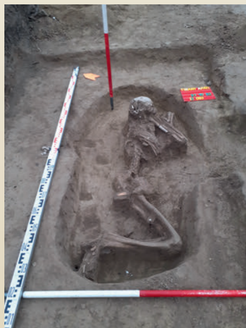
Zsugorított csontváz a Neolitikumból

Az érintett rész eddig csak részlegesen volt kutatva, az őrtoronynál 2002-ben leletmentést és feltárást Rainer Pál régész végzett. Részinformációkból annyi volt tudható, hogy a terület régóta adott otthont állandó lakóinak. Apáti falu első említése a