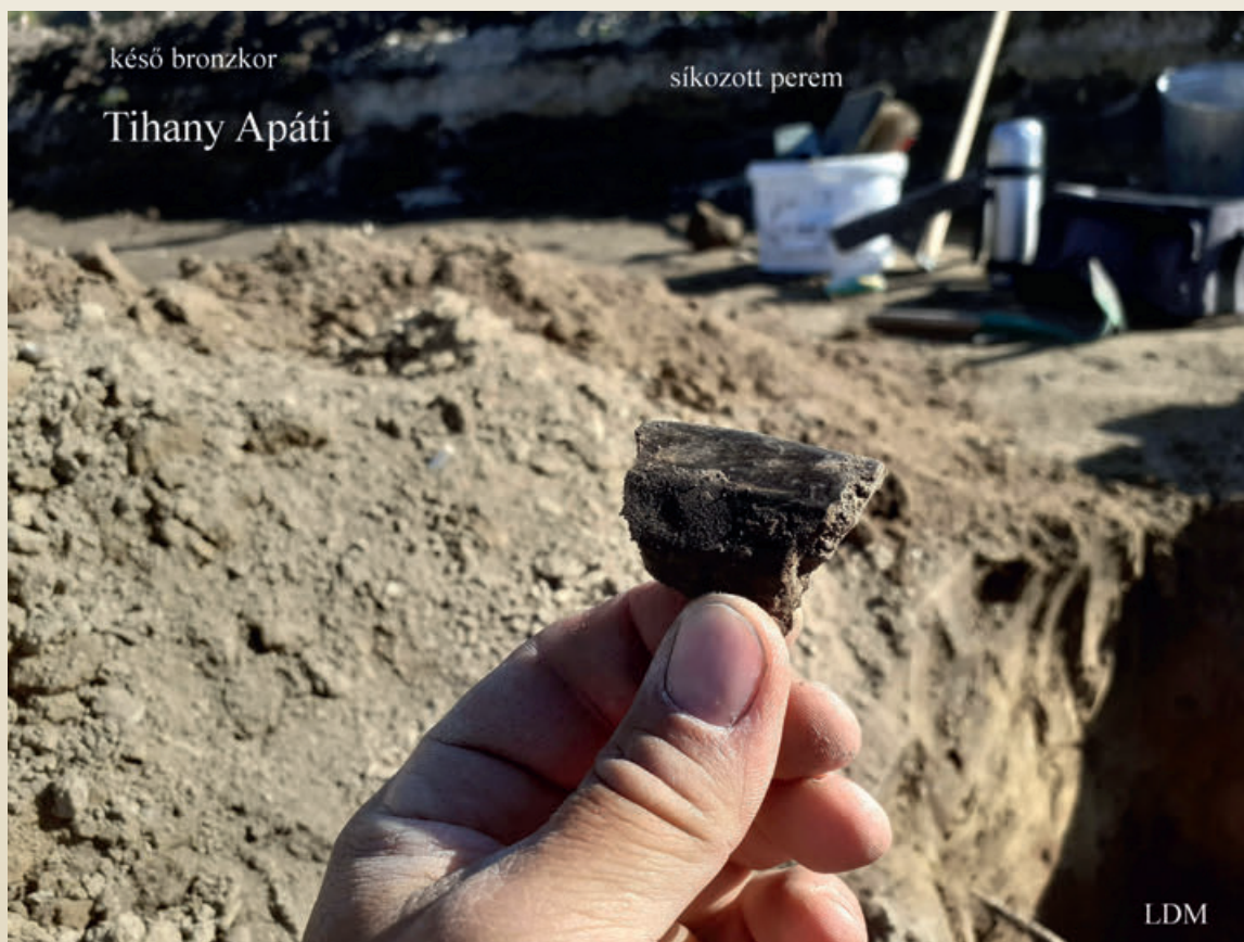
Késő bronzkori urna síkozott pereme ie. 1200-ból

bronzkori urnasíros kultúra időszakára keltezhető földbeásott objektumot, benne nagyméretű kövekből kirakott tűzhellyel és urnatöredékekkel. Érdekes darabok még egy, a Római Birodalom ezen részére jellemző Pannon fibula (ruhakapcsoló tű) darabja az I-II. századból, valamint egy késő római hagymafejes fibula töredéke, illetve pénzermék a III-IV. századból. Az egyik legszebb és legjobb állapotban meglelt ezüst dénár a középkorból, felirata szerint 1527-ből származik, Szapolyai János neve olvasható rajta. Egy másik, 1480-ra keltezhető, cseh területről esetleg a zsoldosokkal idekerült, II. László cseh király idejéből származó prágai ezüst pénz, groschen szintén kiemelkedőnek mondható lelet. A középkorból egy szép díszítésű gyűrűt is kezükbe vehettek a régészek, illetve egy bronz pártav merevítőt és egy még fel nem használt ólom puskagolyót. A fémleletek a lelkes önkéntes fémkeresők munkájának köszönhetőek, akik szabadidejükben közösségi régészeti program keretében segítik a régészek munkáját.